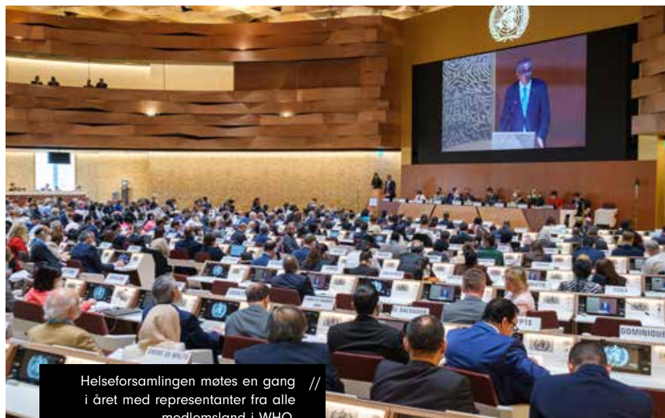
Helseforsamlingen møtes en gang i året med representanter fra alle medlemsland i WHO. //