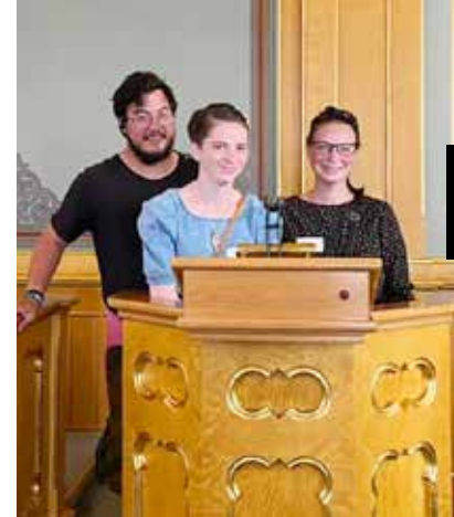
Uro-gruppen besøkte før // sommerferien Stortinget og møtte representanter her.

– Jeg har venner som driver med alkohol. Det er viktig å lære å si ordet nei, sier han.